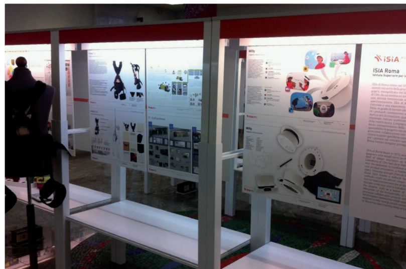
Mostra "PNA|2013, Scuole e progetti in concorso"