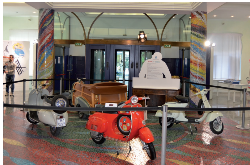
Mostra "Corradino D'Ascanio, Uomo Genio Mito Mago"